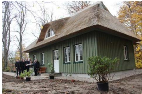
Schlüsselübergabe nach Fertigstellung

Sehr erfreulich war, dass die neue Pellet-Heizung (sowie der dazu erforderliche Lagertank) für das Hausmeistergebäude und das eigentliche Jagdschlösschen mit Mitteln aus der zuständigen Aktiv-Region gefördert wurden. Die Mittelauszahlung erfolgte in 2013.