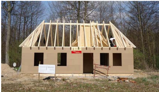
Ansicht des Rohbaus

Die beabsichtigten planerischen Vorhaben konnten in 2012 zwar vollständig umgesetzt werden. Nicht zu halten war die terminliche Planung. Statt Mitte 2012 konnte das neue Hausmeistergebäude erst Ende 2012 fertig gestellt werden. Auch der Einbau einer neuen Heizung für das neue Gebäude sowie für das Jagdschlösschen verzögerte sich.